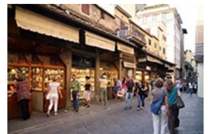
Huizen op de Ponte Vecchio

Ze worden ondersteund door lange houten stutten, sporti genoemd.